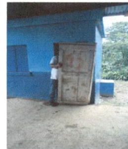
Foto 6: Sustrucción de puerta de madera por metal y de ventana por balcon.

Observación: Si es necesario se pueden agregar hojas adicionales y actualizar el número de hojas.